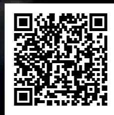
Video de Edel / Edel's video