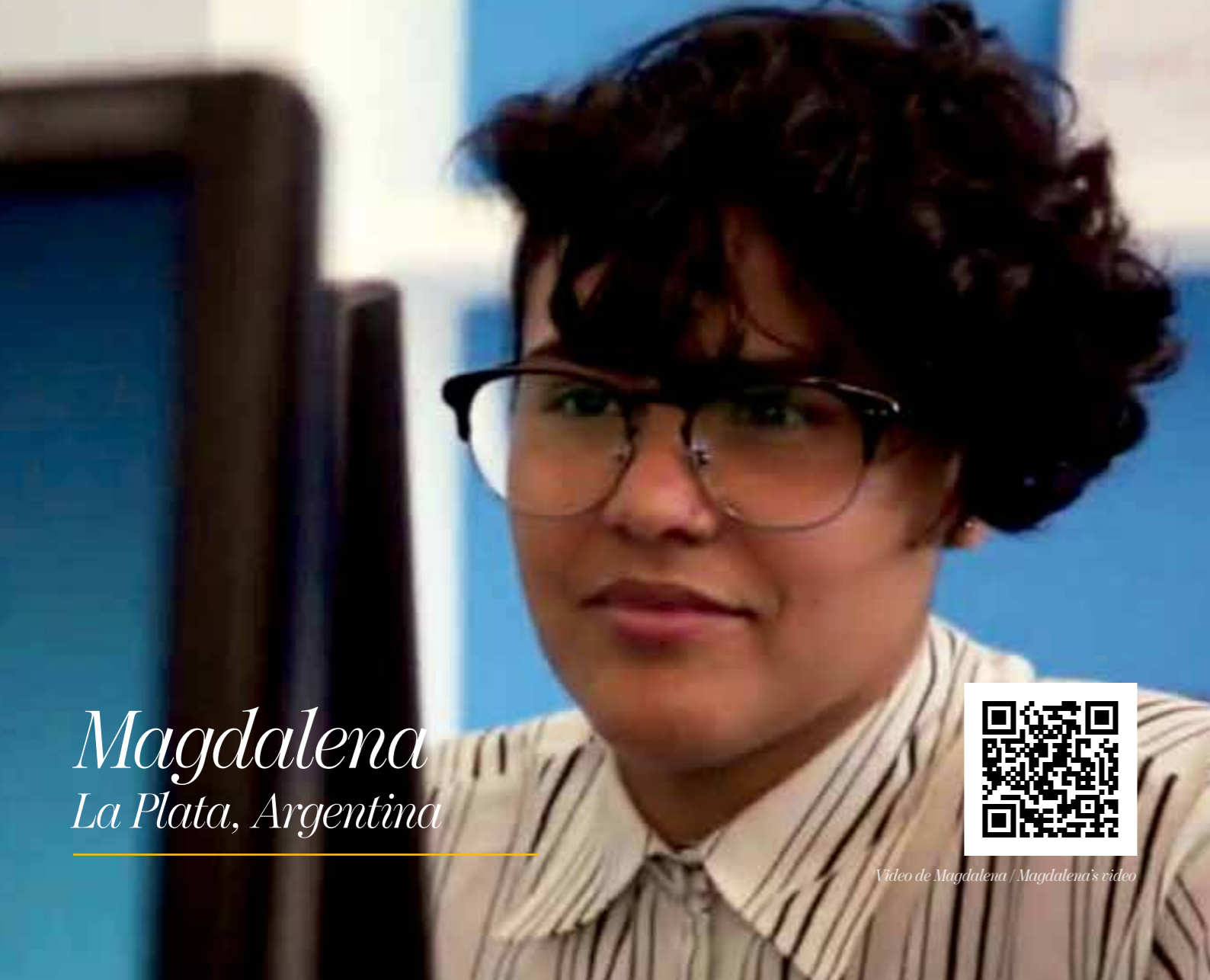
Magdalena La Plata, Argentina