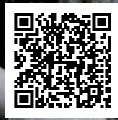
Vídeo de Elisa / Elisa's video