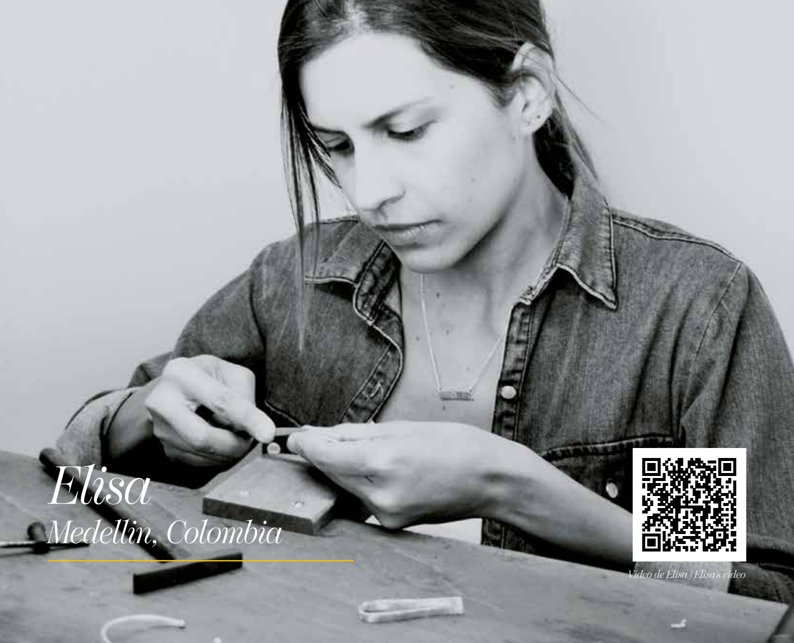
Elisa Medellin, Colombia