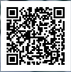
Video de Wilton / Wilton's video