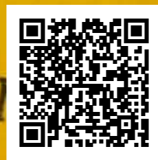
Video de Andrea / Andrea's video

Established NINETEEN SEVENTY ONE FOOTWEAR & APPAREL