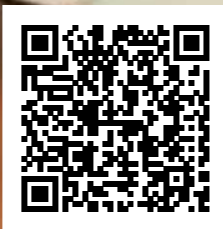
Video de Briggitte / Briggitte's video