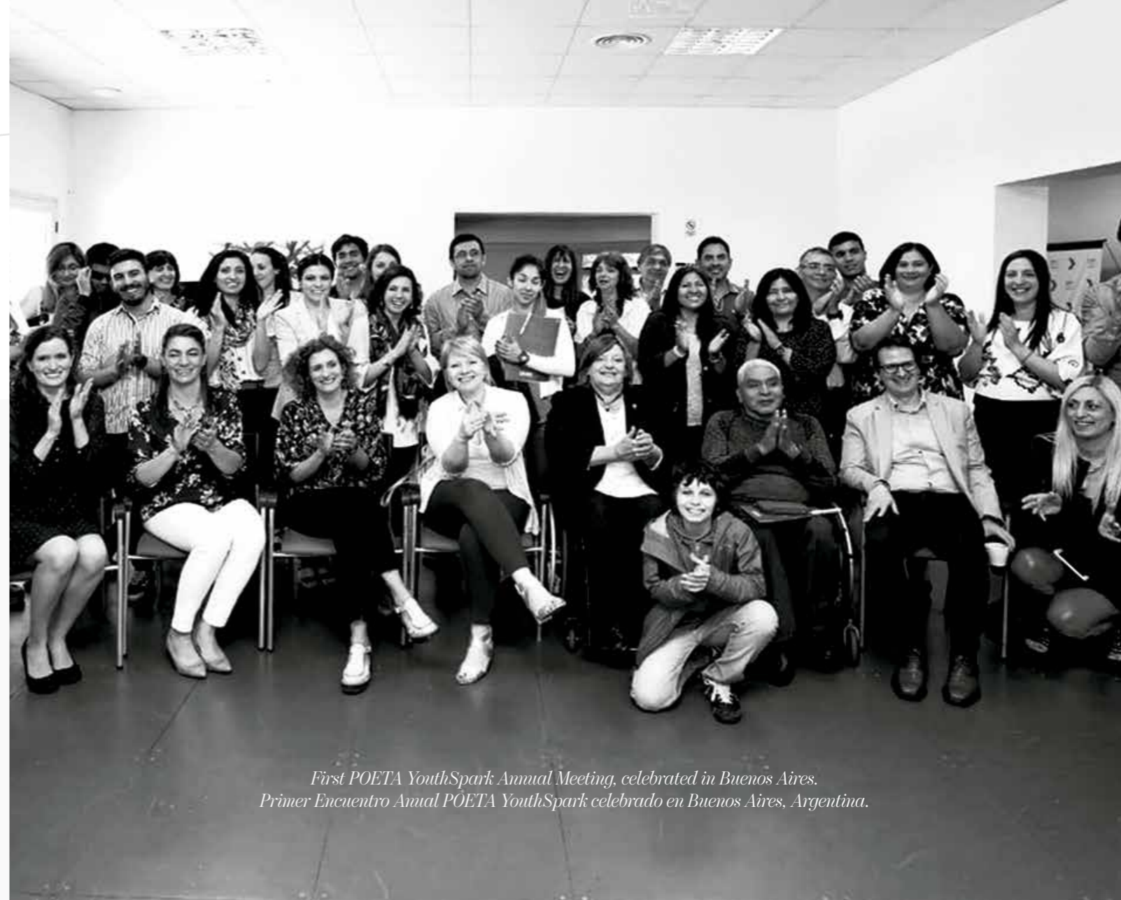
First POETA YouthSpark Annual Meeting, celebrated in Buenos Aires. Primer Encuentro Anual POETA YouthSpark celebrado en Buenos Aires, Argentina.

Nuestra alianza única con la OEA nos permite tener acceso a los tomadores de decisiones dentro de la región. Esta asociación fundamental es la base a través de la cual creamos redes sólidas en todos los estados miembros y el sector privado. A través del desarrollo de nuestra región, The Trust continúa contribuyendo a superar los desafíos a través de alianzas estratégicas que promueven la cooperación para resultados sostenibles.